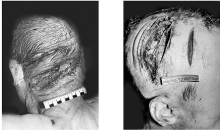
Рис. 113. Множественные рубленые раны на голове